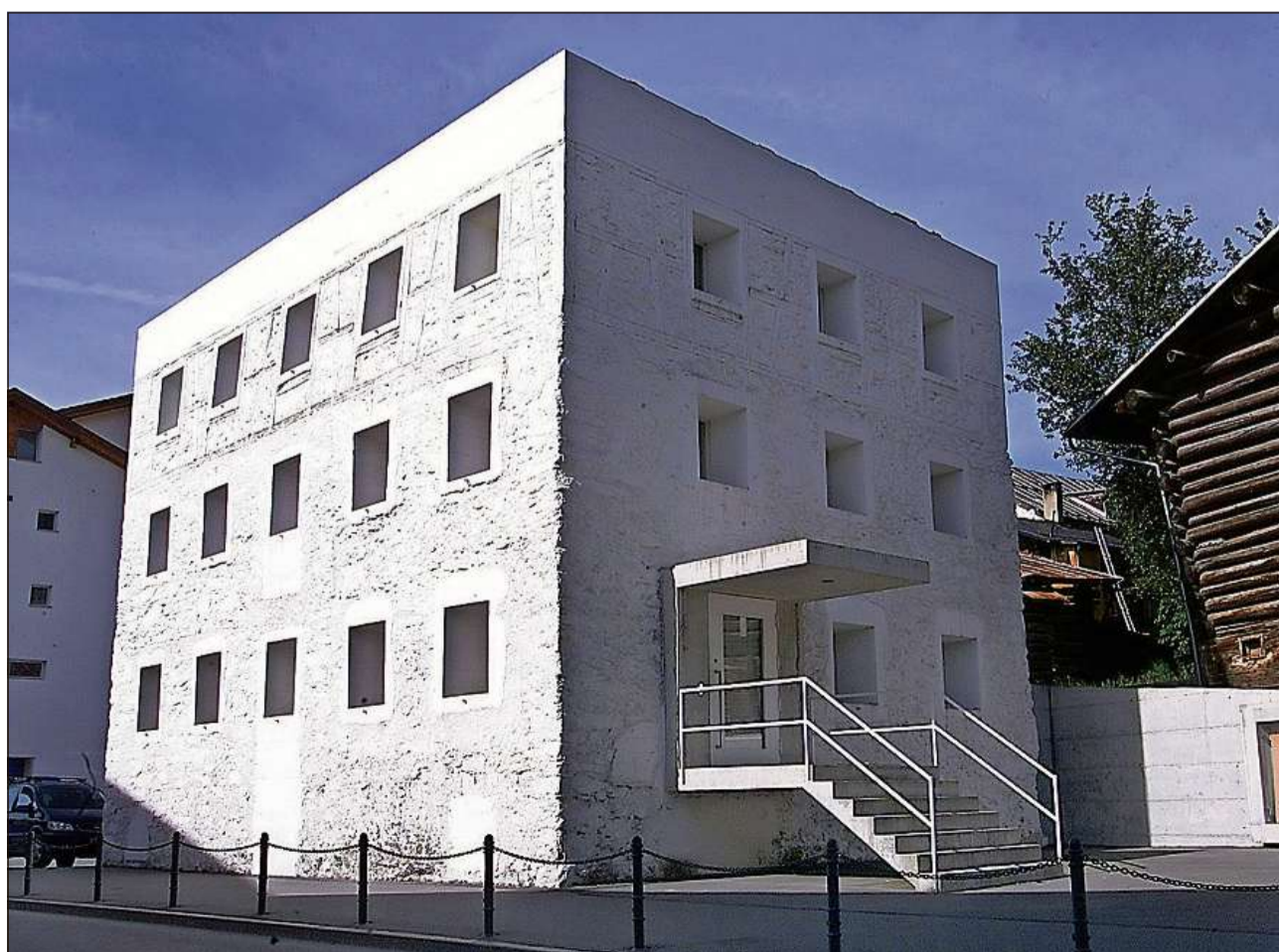
La «Chasa melna» a Flem – in exempel per il stil caracteristic da Rudolf Olgiati.

Il LIR cumpiglia bundant 3100 arttgels (geografics, tematics, arttgels da famiglias e biografias) davart l'istorgia grischuna/retica e la Rumantschia. Editura: Fundaziun Lexicon Istoric Svizzer; versiun online: www.e-lir.ch ; versiun stampada: www.casanova.ch u en mintga libreria.